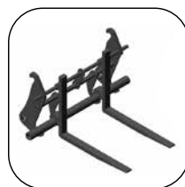
Horquillas para enganche rápido